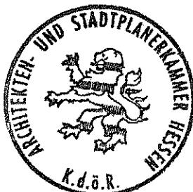
Professor Gerhard Bremmer

Der Inhaber der Urkunde ist befugt, gemäß § 59 HBO 2002 die für ein Bauvorhaben erforderlichen bautechnischen Nachweise für vorbeugenden Brandschutz zu erstellen bzw. zu bescheinigen (ohne dass sie von einem Dritten geprüft werden), sofern das Gebäude der in § 59 HBO 2002 geregelten Gebäudeklasse entspricht. Diese Befugnis gilt nur dann, wenn die Nachweisberechtigtentätigkeit im konkreten Einzelfall unabhängig ausgeübt wird. (Das bedeutet, dass die nachweisberechtigte Person im konkreten Fall keine eigenen Produktions-, Handels- oder Lieferinteressen, noch fremde Interessen dieser Art verfolgen darf, die unmittelbar oder mittelbar im Zusammenhang mit ihrer beruflichen Tätigkeit stehen. Dementsprechend können z.B. Ingenieure oder Architekten, die in Baufirmen angestellt sind, oder Inhaber oder Gesellschafter baugewerblicher Unternehmen, nicht als Nachweisberechtigte tätig werden, sofern sie für dasselbe Objekt neben den bautechnischen Nachweisen auch gewerbliche Leistungen erbringen. Ihre Nachweise gelten als befangen im Interesse ihrer Firma, so dass sie von einem Sachverständigen bescheinigt werden müssen. Andernfalls besteht auch kein Versicherungsschutz!)